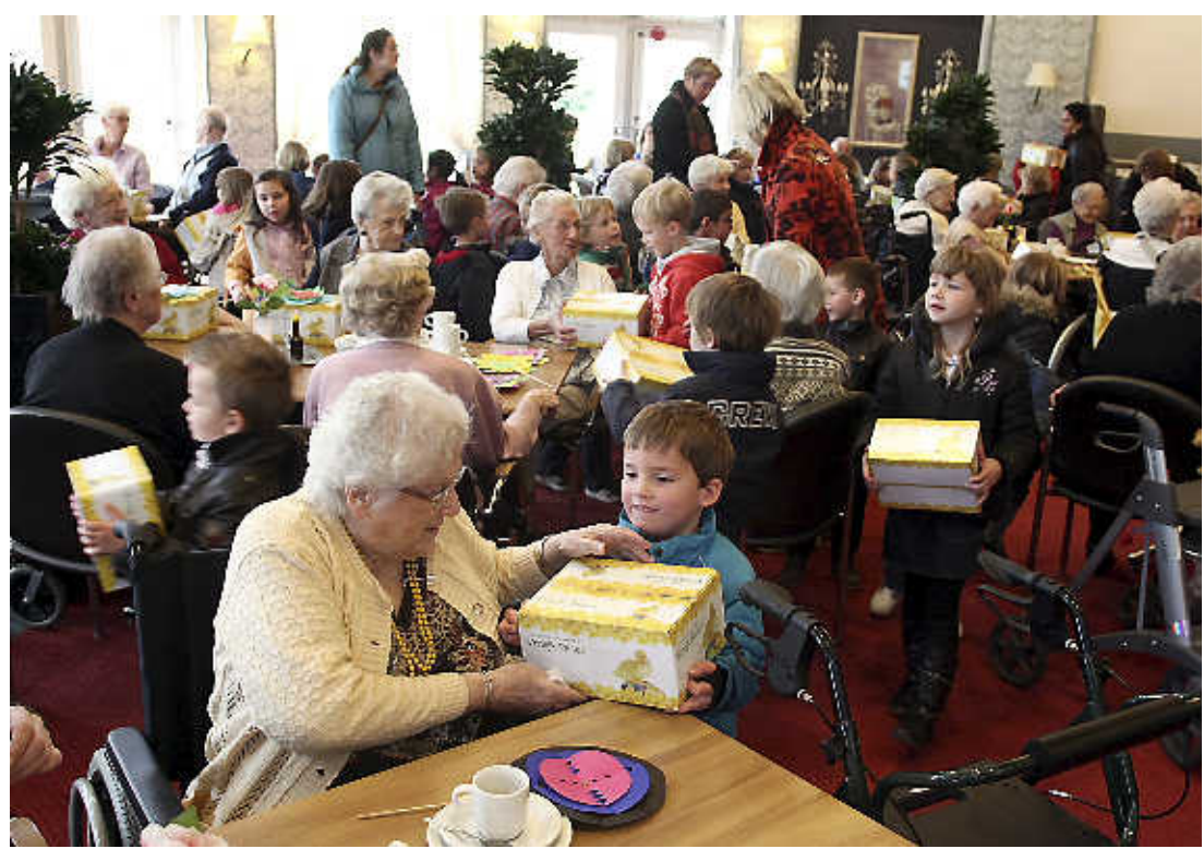
Vrolijke paaspakketten worden aan de ouderen uitgedeeld.