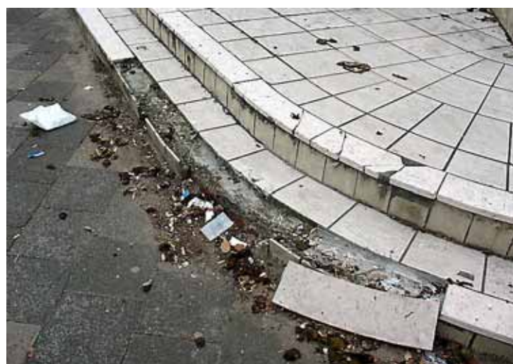
Een kapotte trede bij het oude filmhuis.

HILVERSUM - De ramen van de lobby van het Grand Hotel Gooiland raakt van de houten noodbeboording af. Die heeft drie maanden herinnerd aan de vuurwerkploeg, die daar in de oudejaarsnacht op de stoep zowat alle ruiten vernielde en diverse mensen verwondde.