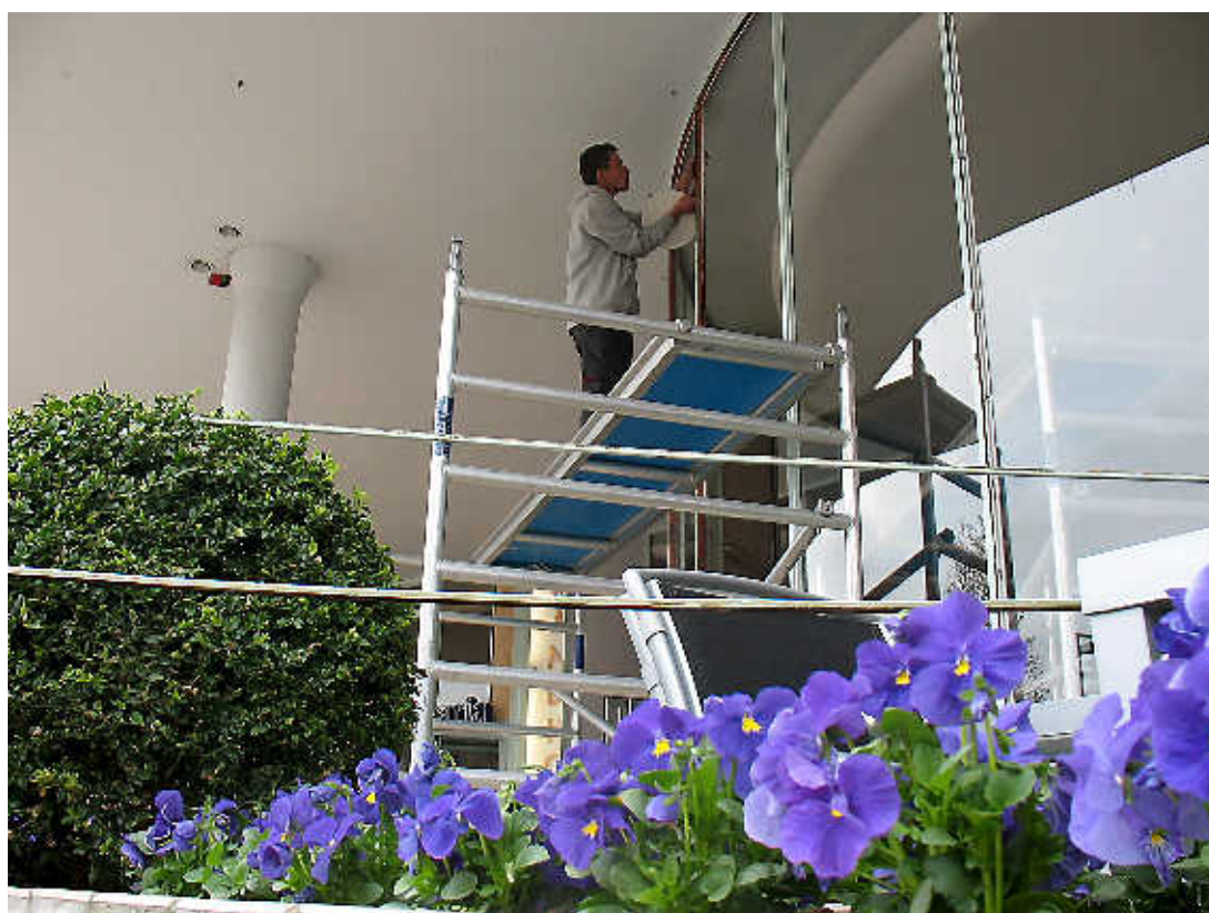
Een glaszetters in actie.

jaar eerder was overleden. Gooiland wordt internationaal gewaardeerd als een mooi voorbeeld van het Nieuwe Bouwen. Het is gemaakt van beton, staal