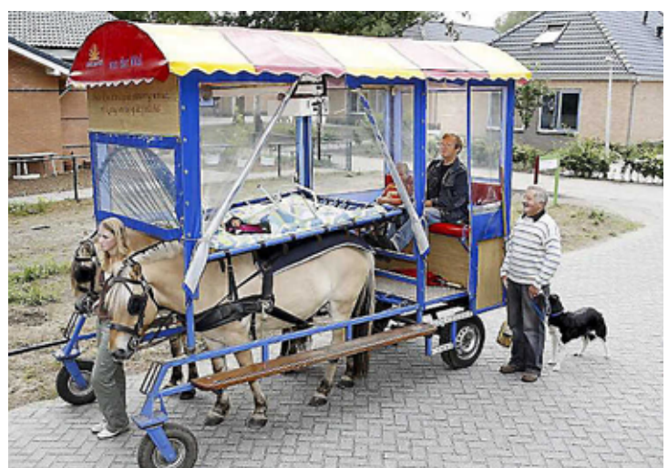
Huifbedrijven, nu even niet.

„Wat is het precies, huifbedrijven?” „Met een lift worden gehandicapten uit hun stoel in een huifbed getild en rondgedragen. Onze zoon doet ook mee. Je ziet hem reageren op de geluiden, geur en beweging van het paard. Het masseert zijn spieren, pezen, botten en darmen. Helpt tegen obstipatie waar veel