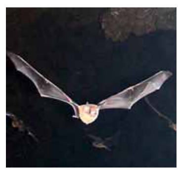
Nachtelijke ontmoeting.

De appartementen zijn geschikt voor senioren. Bovendien wordt de Reiger in de nabije toekomst, met als de bestaande woontorens, door een brug verbonden met Flat Kerke-landen.